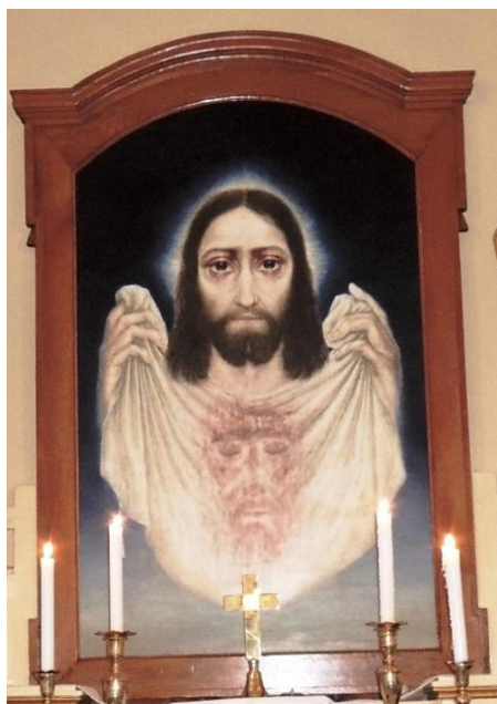
Oltár v roku 2017