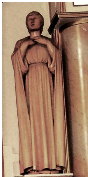
Socha apoštola Jána