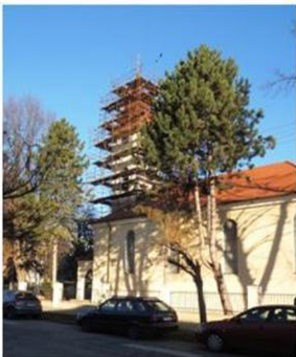
Kostol v roku 2015

V roku 2017 bol pôvodný tvar veže s ihlanovým zakončením obnovený.